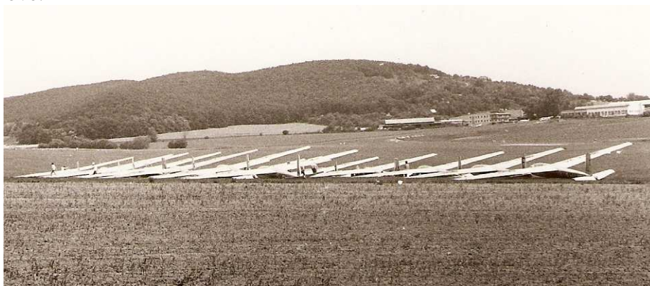
Grid a stojánka závodních strojů v Medlánkách 1988.

Závody juniorů v prehistorické době se konaly na monotypu L 13 Blaník. Protože se za těch dvacet let spousta věcí změnila, chtěl bych trochu zavzpomínat a připomenout historii juniorských mistrovství v Čechách z dob našeho mládí. Juniorky se v letošním roce konají ve Dvoře Králové, kde jsem se v roce 1987 nominoval z Krajského přeboru na mistrovství juniorů České socialistické republiky, konané na letišti v Brně Medlánkách ve dnech 18.6.-2.7.1988. Jak se můžete přesvědčit ve statistice, junioři se letos oprávněně vrací na letiště ve Dvoře Králové již po několikáté. Jen v době socialismu z devíti závodů probíhaly čtyřikrát ve Dvoře Králové.