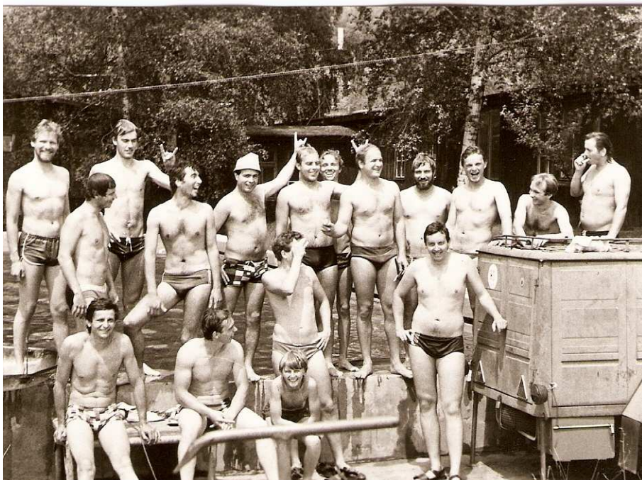
Závodníci u bazénu.